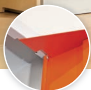
stoppeur de porte résistant