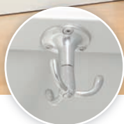
avec des crochets tournants