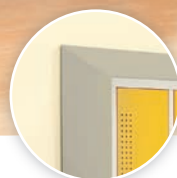
avec dessus incliné en option et supplément